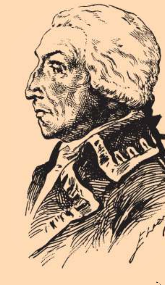
Nicolas LUCKNER (1722 - 1794)

Lieutenant général en 1763, maréchal de France en 1791, il commande l'armée du Rhin, puis l'armée du Nord.