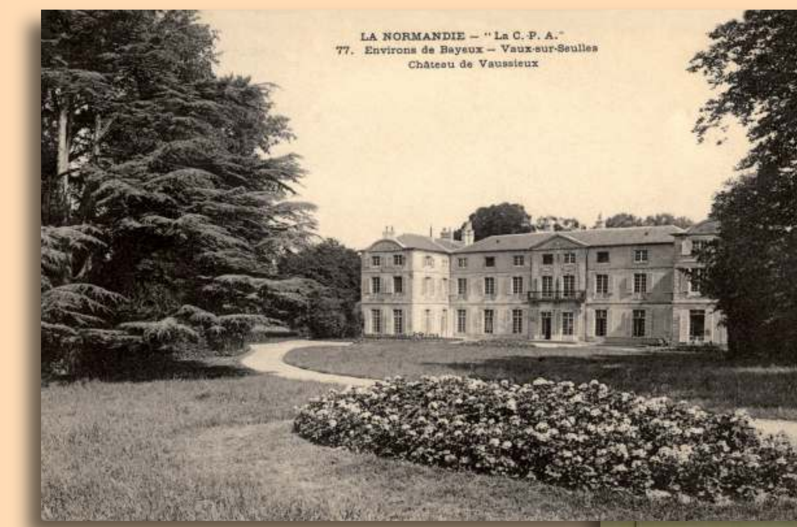
CHATEAU DE VAUSSEUX