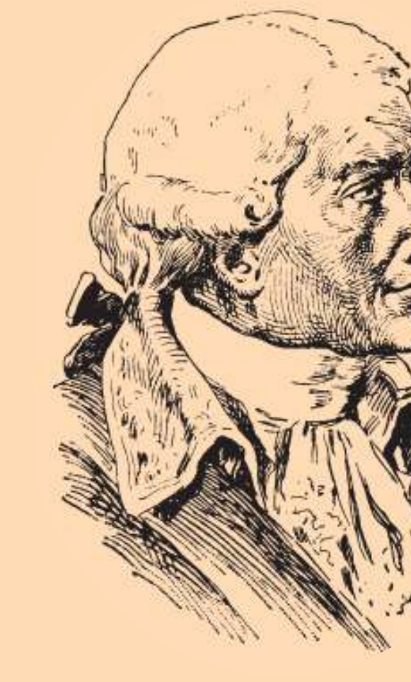
Jean-Baptiste Donatien de Vimeur, comte de ROCHAMBEAU (1725 - 1807)

Très jeune, il fut reconnu pour sa bravoure dans les manœuvres. Il fut nommé maréchal de camp en 1761 et inspecteur de la cavalerie.