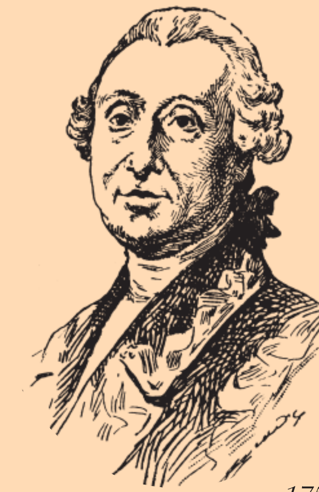
Victor-François, duc de BROGLIE (1718 - 1804)

Le " Camp de Vaussieux " a d'une certaine façon contribué à l'indépendance des Etats Unis.