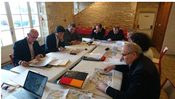
Mairie d'Esquay-sur-Seulles le 15 décembre 2017