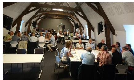
10/09/2016, Bayeux Intercom