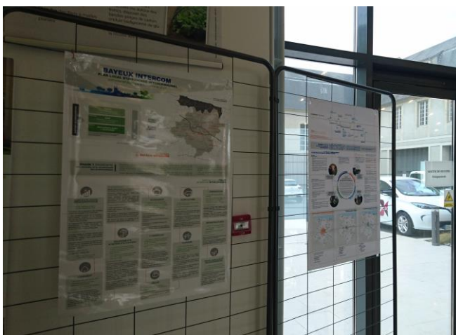
Hall de Bayeux Intercom

Concernant les moyens offerts au public pour formuler ses observations et propositions :