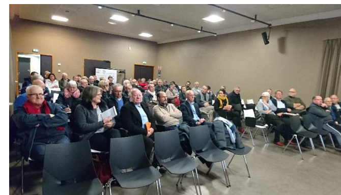
Réunion publique du 28 novembre 2017.