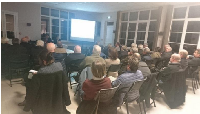
Réunion publique du 17 Janvier 2019 à Campigny.