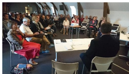
01/10/2016, Bayeux Intercom