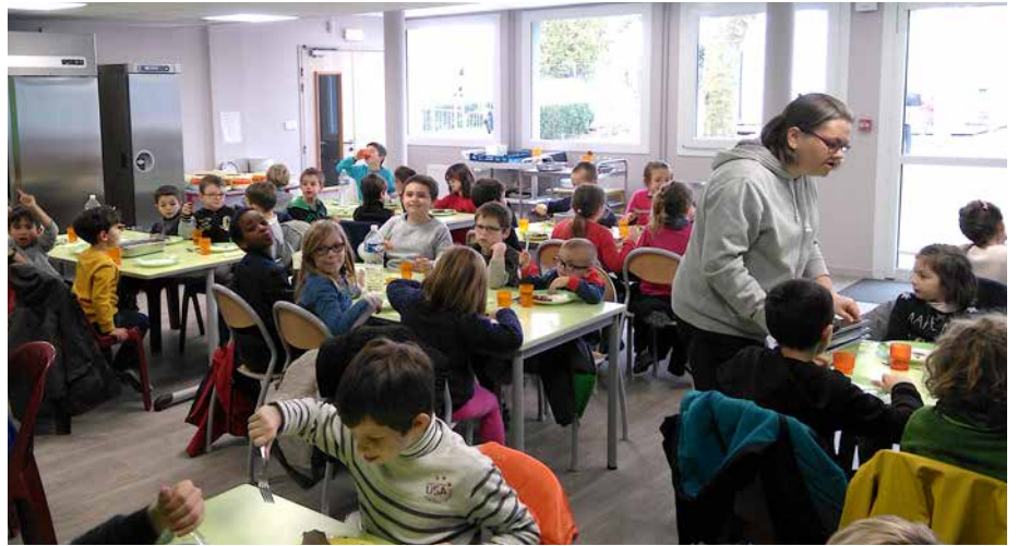
Bayeux Intercom a pris la compétence enseignement en 2006.