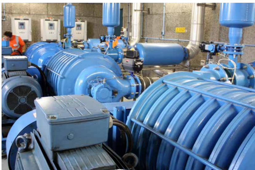
Bayeux Intercom dispose de ses propres stations d'épuration - ici, Eldorad'eau.

proposer aux élèves des classes vertes, aujourd'hui financées par l'intercom », poursuit l'élú.