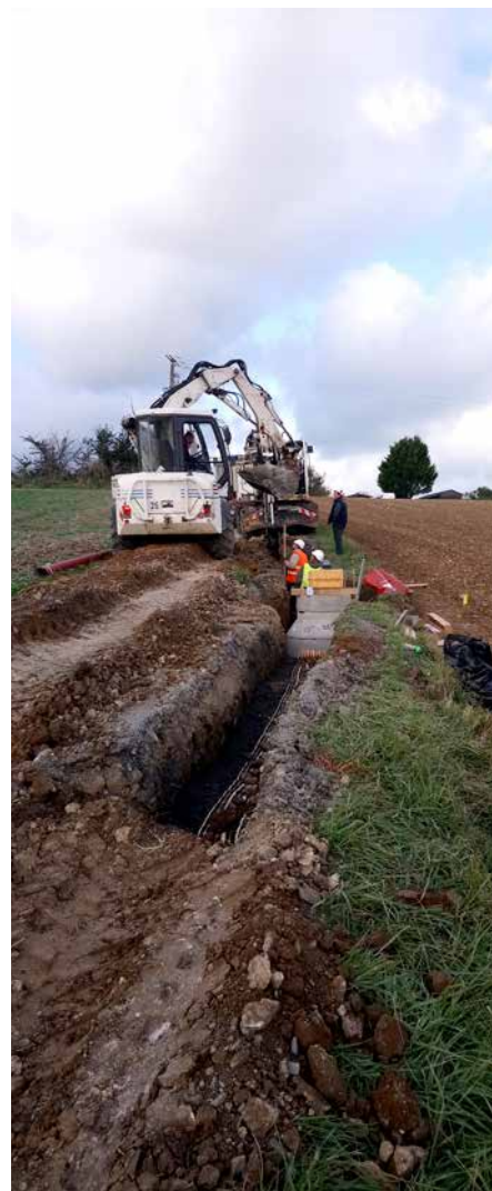
Un poste de transfert est en cours de réalisation, chemin de la Paix : toutes les eaux usées de Longues-sur-Mer y seront collectées avant d'être renvoyées vers l'unité de traitement des eaux usées de l'agglomération bayeusaine.

En même temps que les travaux d'assainissement, le réseau d'eau potable fait également l'objet de travaux de réhabilitation sur la commune, pour un montant de 593 000 € HT.