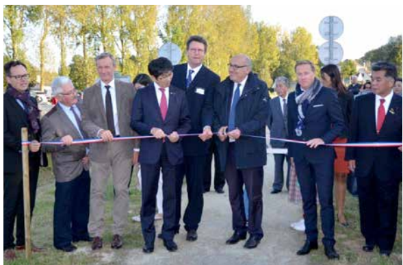
Le chemin de la Paix a été symboliquement inauguré le 28 septembre.

La commune de Vaux-sur-Aure a profité de l'occasion, dans le cadre du 40 e anniversaire de son jumelage avec la ville de Nagasaki, au Japon, pour symboliquement inaugurer le « Chemin de la Paix », correspondant à la sente piétonne entre le pont routier et l'église.