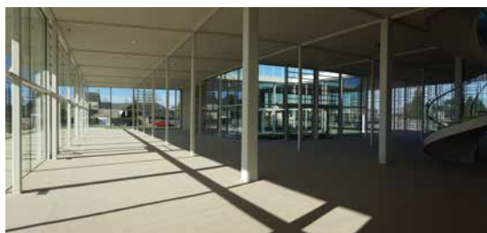
Le déménagement des 80 000 ouvrages a commencé.

L'ouverture des 7 lieux est prévue en février 2019. Toute l'équipe - 12 personnes - est actuellement à pied d'œuvre pour référencer et préparer le déménagement des 40 000 ouvrages du fonds courant et des 40 000 références du fonds patrimonial. Les tarifs ont également été votés. L'abonnement sera gratuit pour tous les résidents et personnes travaillant sur le territoire de Bayeux Intercom. Les horaires seront élargis à 48 heures par semaine (au lieu de 25 actuellement) : du mardi au samedi de 10h à 19h (sans interruption) et le dimanche de 15h à 18h.