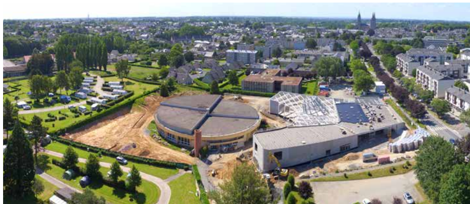
Le futur centre aquatique Auréo vise 130 000 entrées par an.

Avec un objectif de 130 000 entrées par an (soit le double de la fréquentation de l'ancienne piscine, en cours de démo-