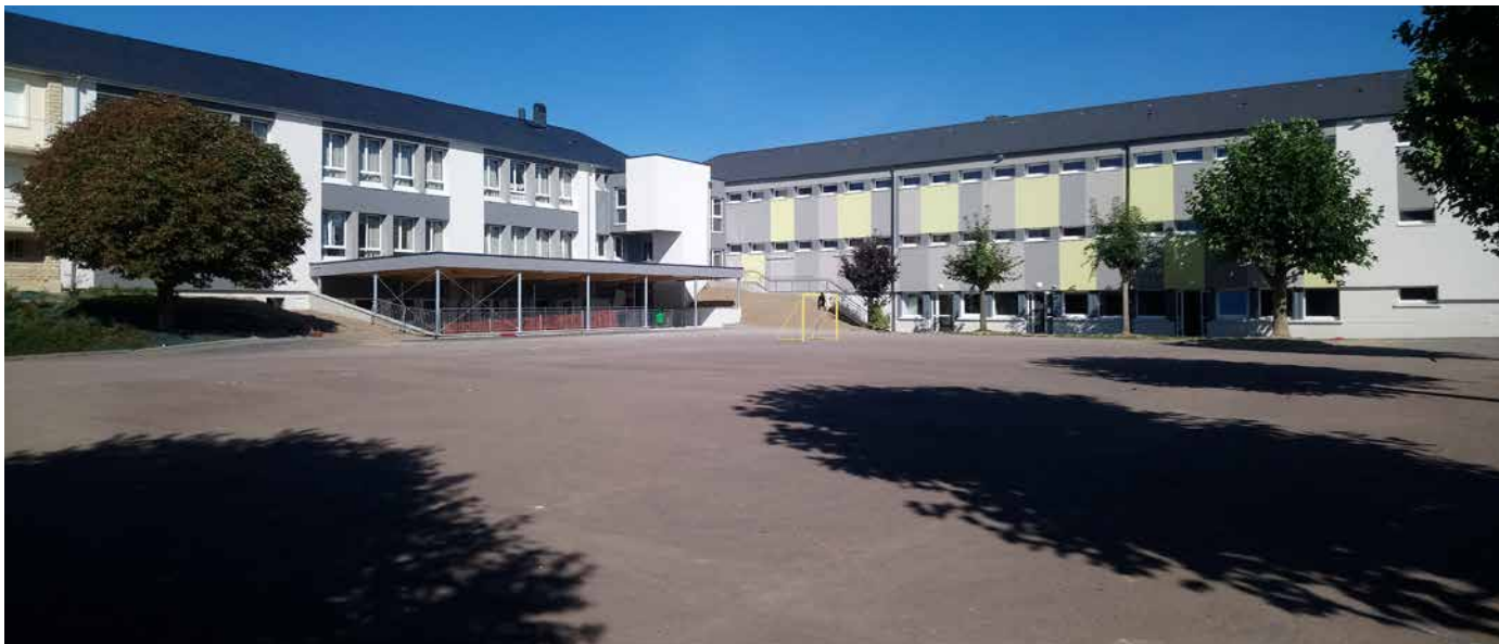
La cour va bénéficier d'un nouveau revêtement et des jeux y seront installés.

Bayeux Intercom a pris la compétence Enseignement en 2006. Elle représente la part la plus importante de son budget de fonctionnement : 5 M € chaque année (dont la rémunération de 120 agents) au profit de 2 100 élèves répartis sur 14 sites.