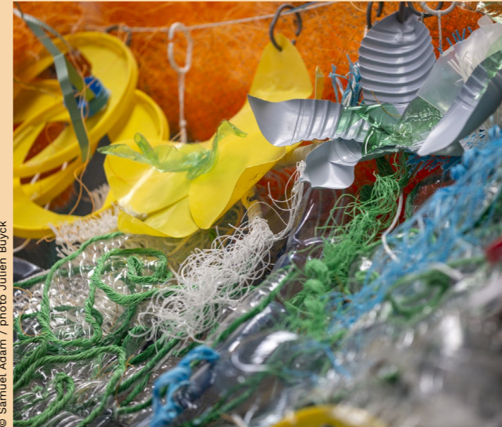
© Samuel Adam / photo Julien Buyck